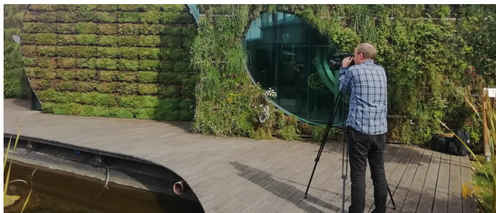
Natáčení v LIKO-S ve Slavkově u Brna