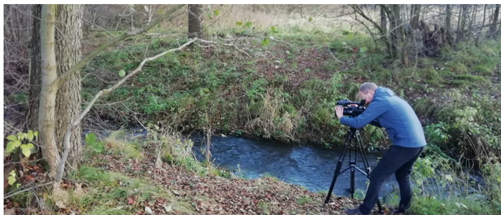
Natáčení v Jablonném v Podještědí

Projekt spolufinancován ze Státního fondu životního prostředí České republiky na základě rozhodnutí ministra životního prostředí.