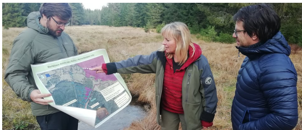
Natáčení v NP Šumava